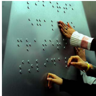
Feeling things par Hé'louïse (2006)

Les études sur les interactions avec la mère et son entourage montrent que la cécité perturbe sensiblement les interactions sociales du bébé. Cela est dû au fait que dès la naissance, le bébé aveugle est isolé des personnes qui l'entourent, les échanges par le regard étant impossibles. La cécité modifie les codes sur lesquels se fondent les échanges non verbaux entre la mère et le bébé. Par exemple, le bébé ne tourne pas la tête vers sa mère quand elle lui parle et l'expressivité du visage est absente. Les parents, souvent mal informés des problèmes liés à la cécité, peuvent agir avec maladresse. Notamment, la mère, occupant une place privilégiée avec l'enfant, trouve difficile de comprendre son bébé aveugle, d'interpréter ses besoins et plus tard son langage. La plupart du temps, l'enfant aveugle est ainsi contraint de s'initier lui-même pour comprendre le monde extérieur et pour interagir avec. Pour cela, il utilise avant tout le toucher et l'audition. Or l'écoute nécessite une certaine concentration et surtout une certaine immobilité, attitude qui a pour conséquence de déstabiliser les personnes qui constituent son entourage.