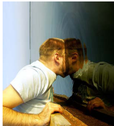
Wasserspiegel par froodmat (2005)

De manière plus spécifique, les informations visuelles dans la communication face à face ont plusieurs buts. Elles répondent au niveau de l'interaction à des besoins comme a) établir le contact avec autrui, b) coordonner les tours de parole ; c) contrôler l'attention et la compréhension de l'auditeur. Ces buts peuvent être atteints grâce à l'orientation corporelle, les gestes et le regard. Ce dernier occupe une place particulière dans les interactions humaines. Kendon et ses collaborateurs (1981) soulignent notamment que le regard remplit trois fonctions : une fonction d'expression, une fonction de régulation et une fonction de contrôle. La fonction d'expression est accomplie par le fait que le regard transmet à autrui nos émotions, nos attitudes ; la fonction de régulation concerne l'ouverture, la synchronisation et la fermeture d'un échange verbal, d'une interaction verbale ; enfin la fonction de contrôle du regard permet de recueillir des informations analogiques, non verbales, propres à son interlocuteur afin d'adapter son comportement (verbal ou non verbal) aux caractéristiques de l'interlocuteur. Dans ce sens, la perception des réactions de l'autre constitue un élément important pour la poursuite de l'interaction.